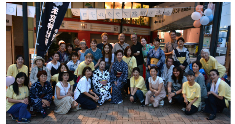
SGG Sponsored Bon Odori Jul 13th

Hatsushima: Take a 30-min ferry ride to the only inhabited island in Shizuoka. Enjoy the famous Hatsushima Don (seafood bowl), sea-water swimming pool (open only during the summer), the lighthouse, a 4-km-walk around the island and more! Bring a hat and water & stay hydrated.